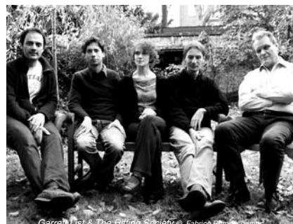
Garrett List & The Riffing Society