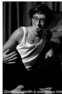
Quentin Dujardin

Pour incarner la 1 ère édition du Festival Confluences, la commune de Comblain-au-Pont a invité des artistes belges de renom, dont les musiques partagent une même énergie puisée dans leurs racines artistiques, au gré de leurs rencontres humaines, et parfois même au contact de la matière. La programmation du Festival a été conçue pour offrir une diversité de styles et de talents et privilégier la découverte de divers univers musicaux.