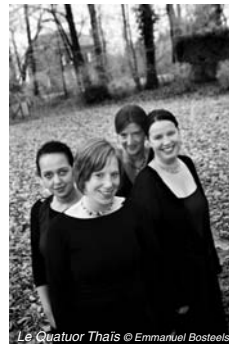
Le Quatuor Thaïs