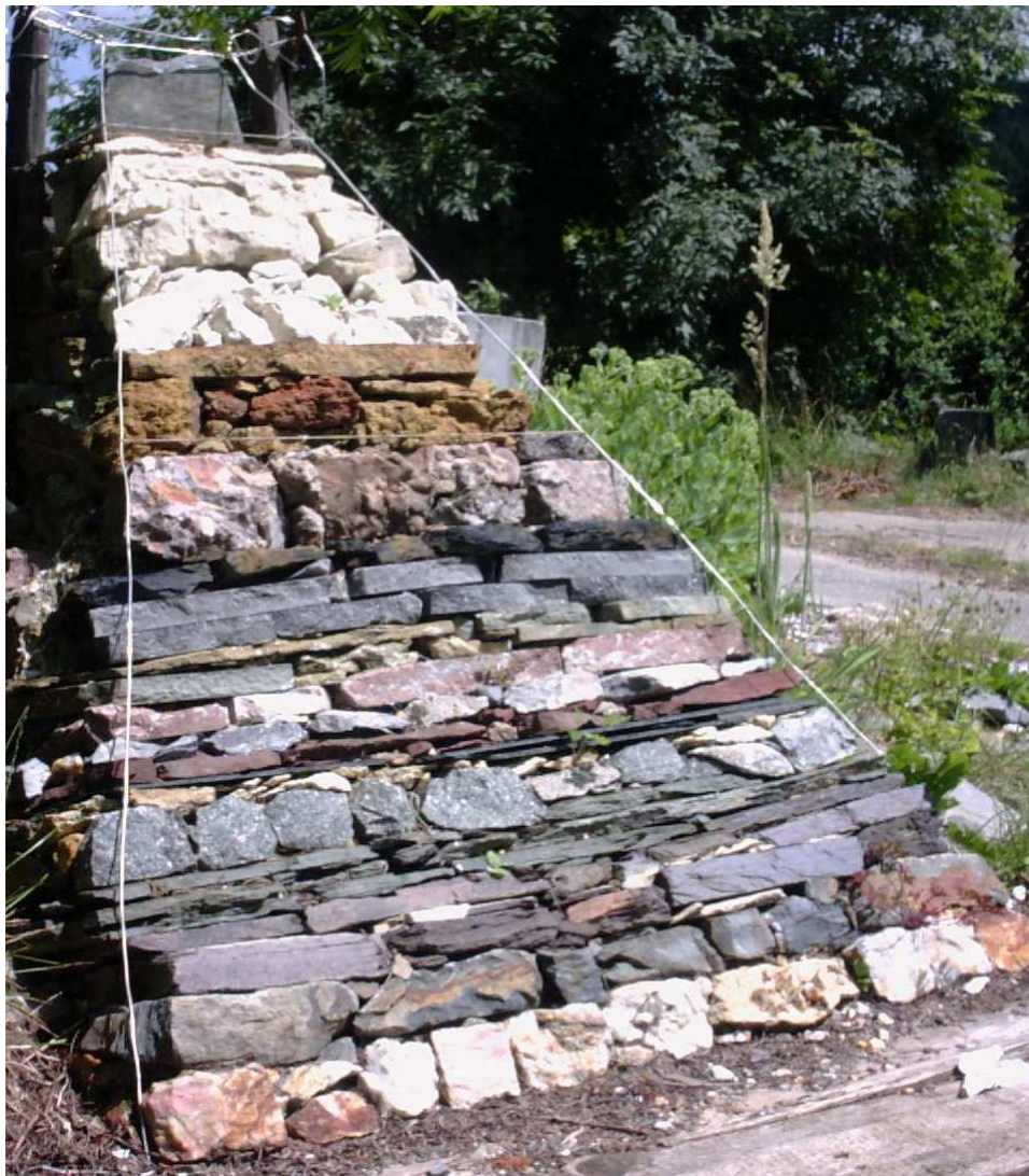
Photo 3 : vue de la maquette au 1/50 réalisée par Paolo Gasparotto