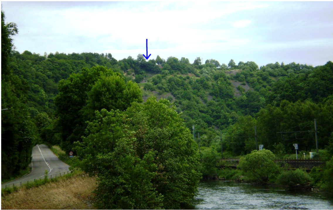
Photo 6 : vue du site depuis la vallée (du pont de Comblain-la-Tour)